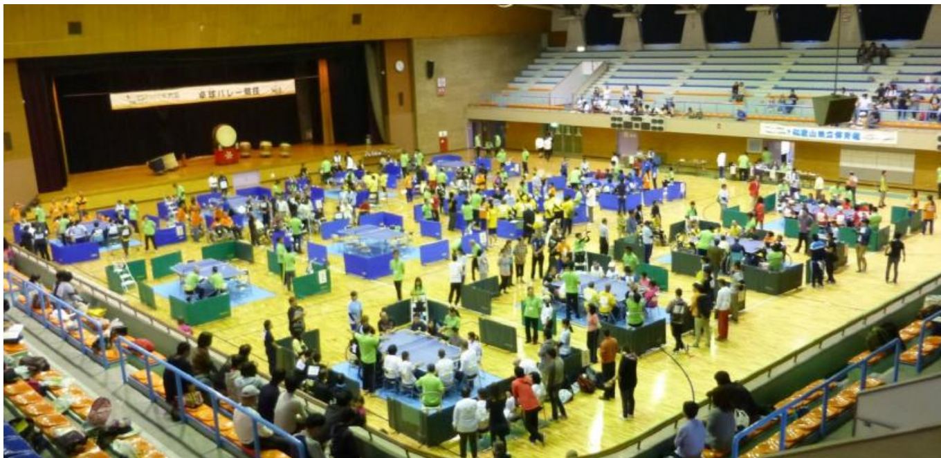
第15回全国障害者スポーツ大会「紀の国わかやま大会」卓球バレー競技(和歌山県立体育館)